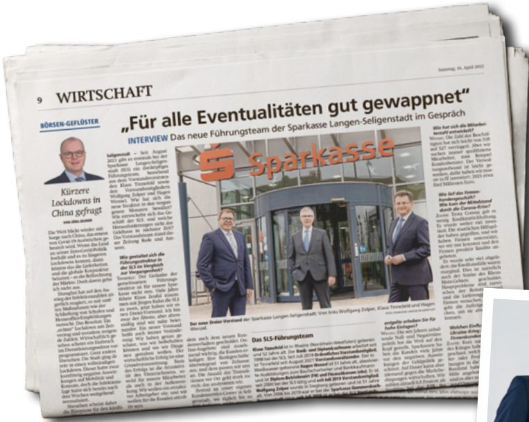
Am 14.04.2022 stellte sich das neue „Vorstands-Trio“ den Fragen der Wirtschaftsredaktion der Offenbach-Post.