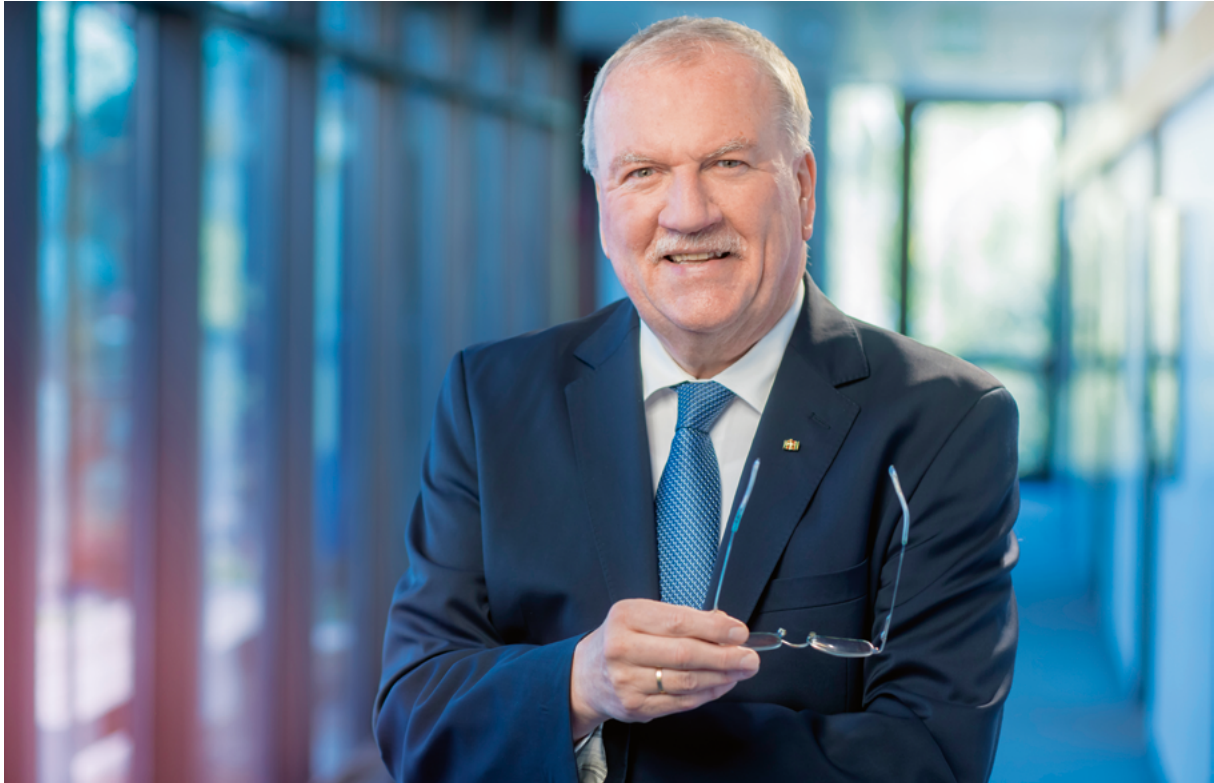
Frank Lortz, Landtagsabgeordneter, Vizepräsident des Hessischen Landtags