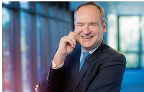
Oliver Quilling, Landrat des Kreises Offenbach